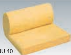
URSA MNU 40 URSA 35 et 32