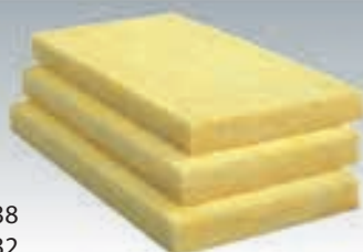
URSA PNU 38 URSA PNU 32